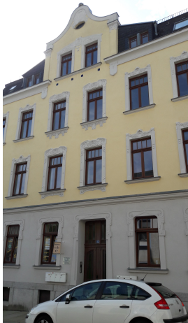
Sidonienstraße 12 Dachgeschoss / links 70,44 m 2